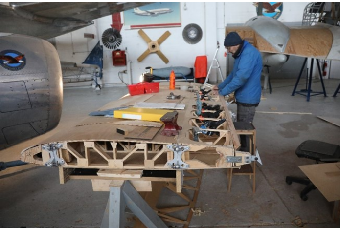
Vingen under arbeid