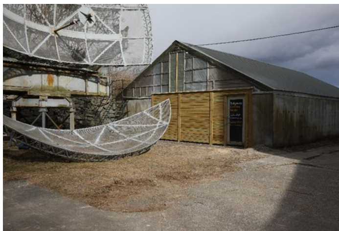
Tanken med ny endevegg

Parallelt med at kabelen legges om er arbeidet med de forberedende arbeidene som må gjøres før byggearbeidene kan starte i gang. I forrige nummer fortalte jeg om kuttingen av betongen på gavveggen på He 115 tanken. Dette arbeidet er ferdig og bildet over viser hvordan veggen nå ser ut med betongen erstattet av elementer som lett kan tas ut når de store delene av He 115 skal ut av tanken.