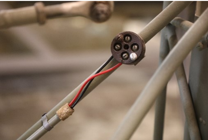
Litt av de elektriske installasjonene