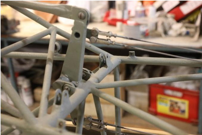
Wirene til roret