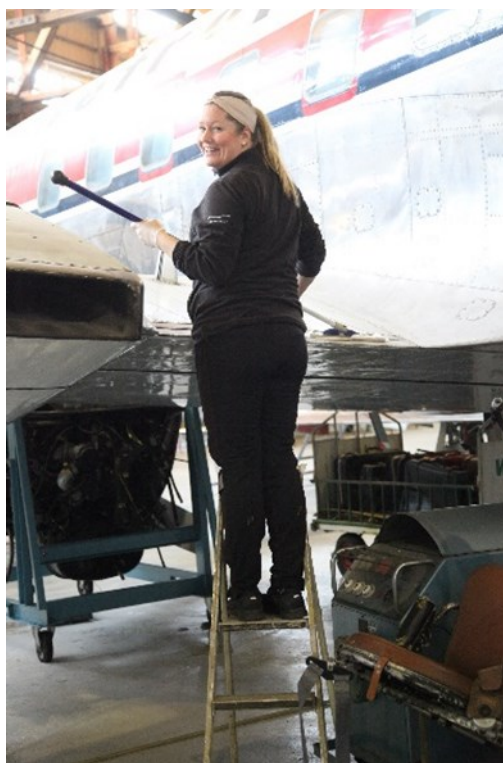
Fra en tidligere dugnader

Vi vil igjen minne om vårrengjøringen. Jærmuseet arrangerer hver vår en dugnad, for å gjøre klar museet til åpning. Dette inkluderer vasking, støv tørking og annet nødvendig arbeid. Jærmuseet inviterer folk fra alle avdelingene sine til å delta, og Venneforeningen har også deltatt i arbeidet. Dette året er dugnaden berammet til 26. og 27. april. Sett av disse datoene dersom du har anledning til å delta en av dagene eller aller helst begge.