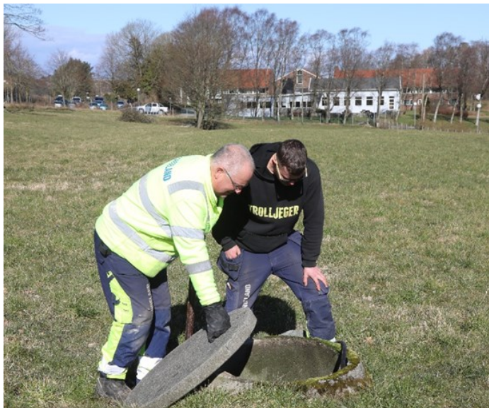
Her er har vi funnet frem til kummen som gir vann til hangaren.

Et av de problemene vi står ovenfor er å finne ut av hvordan vann og avløpsrør ligger på området i Sømmevågen. En del av disse er fortsatt forsvarrets eiendom, og tegningene er fortsatt klassifisert som fortrolig, slik at vi ikke kunne få kopier, men måtte bare kopiere informasjonen på tegningene. Sammen med entreprenøren, T Stangeland maskin har vi nå fått en rimelig god oversikt.