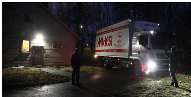
Bilen manøvreres på plass bak 720