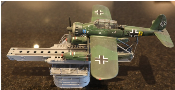
Flyet på utstillingsrampe