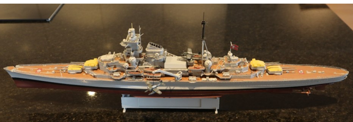
Modell av Blücher

Disse to modellene er enda ikke kommet på plass på grunn av problemer med glasskapet de skal stå i.