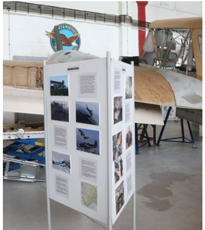
Kjell Dahle har laget en ny søyle med informasjon om Caproni 310, som bidrar til gjøre flyet til et mer interessant objekt

Disse to modellene er enda ikke kommet på plass på grunn av problemer med glasskapet de skal stå i.