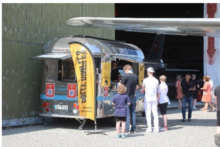
Dette året var det Lura Turistheim som sto for Pizza salget, som dette året gikk uten problemer.