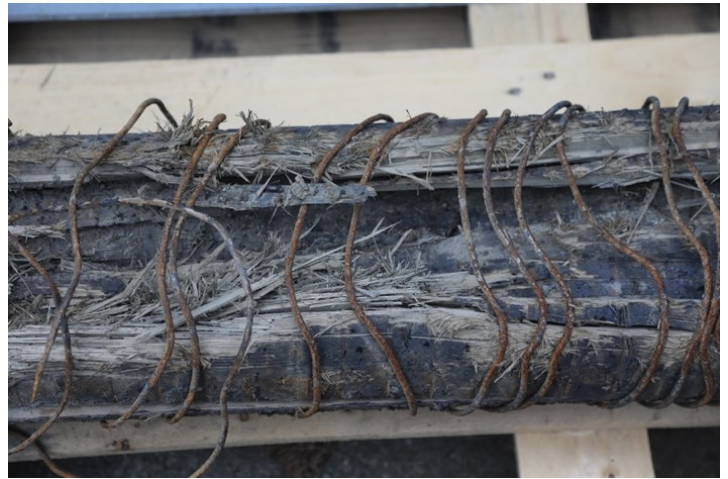
Konstruksjonen av rørene minner litt om slik en lager tønner, med tilskåret plank som bindes sammen med ståltråd