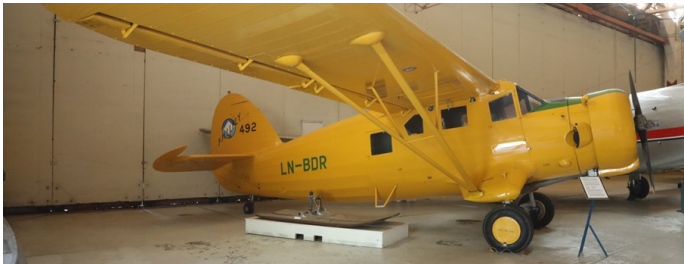
Den nye døren vil komme til venstre i bildet

Adkomsten til hangaren gjennom hoveddøren blir stengt og vil forbli stengt gjennom hele byggeperioden på grunn av arbeidene. Det er utarbeidet en brannrapport for museet i forbindelse med nybygget. Den krever en ny nødutgang fra hangaren i og med at den nåværende hoveddøren som også fungerer som nødutgang blir en innvendig dør vil den ikke lenger kunne brukes som nødutgang. Løsningen er kommet frem til er å bygge en ny dør i en av portseksjonene bak det Norseman står i dag. Den vil fungere som hovedinngang i byggeperioden, og som nødutgang når nybygget tas i bruk