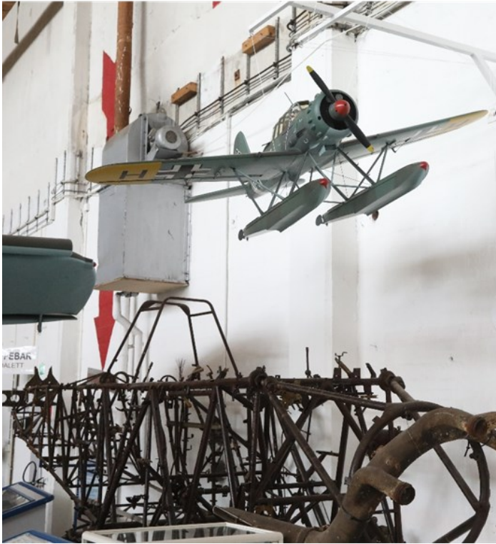
Modell av Arado 196 i utstillingen