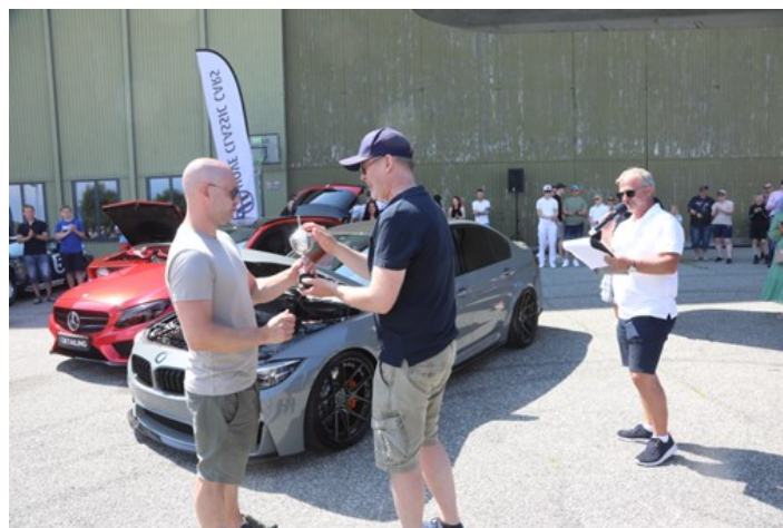
Og til slutt var det premiering av de beste utstilte bilene.